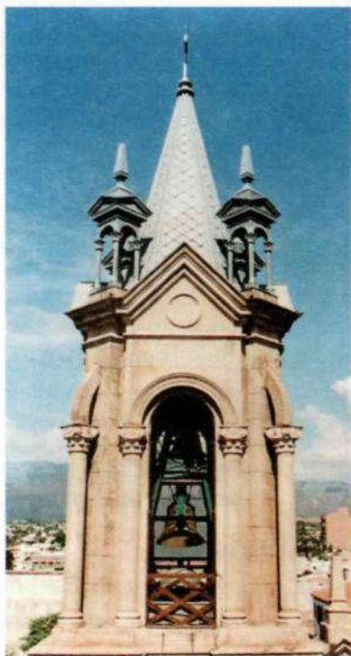
Torre del campanario

No había acabado de invocarlo -dice en la na-