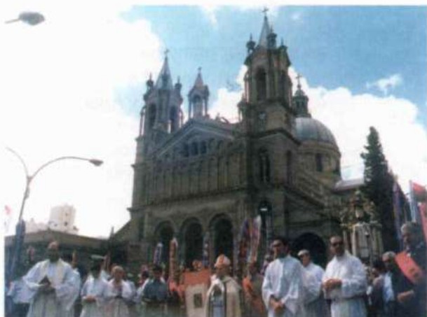
31 de diciembre, Fiesta del Tinkunaco