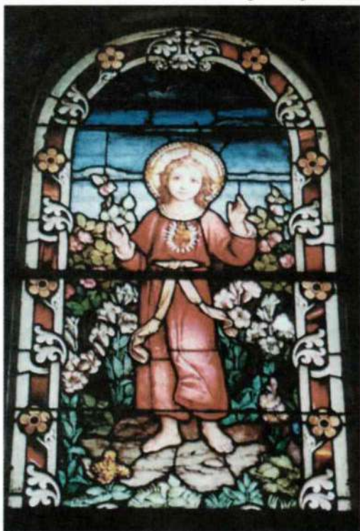
Vitreaux del Niño Jesús. Interior del Templo