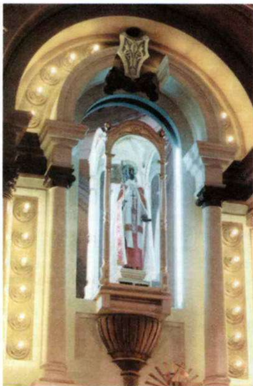
Detalle altar mayor