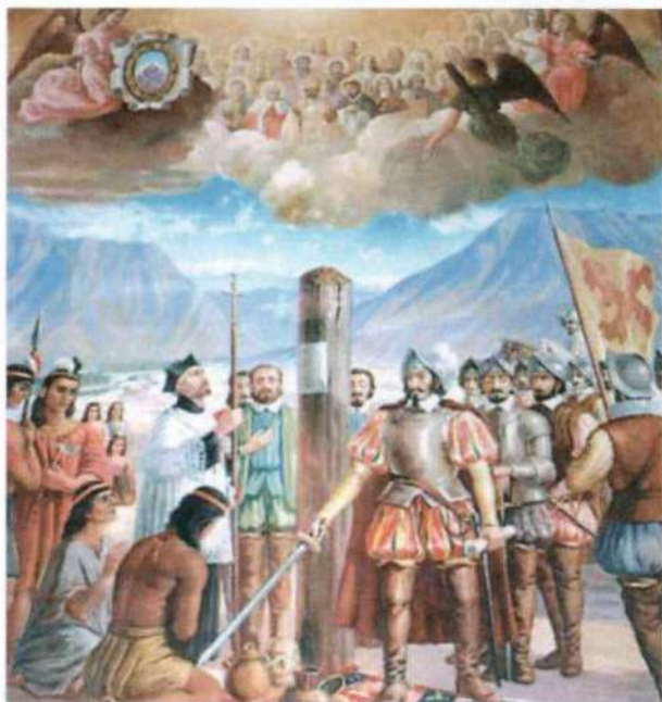
Mural que recuerda la Fundación de la Ciudad de La Rioja.