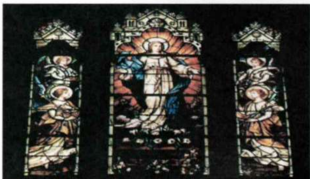
Vitreaux de la Asunción de María Interior del Templo

Recogió en un pañuelo la suma suficiente en monedas de oro, y a escondidas, durante la noche, arrojó la bolsa por la ventana de la casa del hombre. Después, de prisa regresó a su casa. Al clarear el día, el hombre se levantó de su cama, halló la bolsa con las tintineantes monedas de oro y con las lágrimas en los ojos, henchido de gozo, dio gracias a Dios. Mientras tanto, procuraba saber de donde le había caído semejante beneficio. Acogiendo este don como si le hubiera sido enviado por Dios y observando que la suma de dinero era suficiente para una dote, preparó el dormitorio nupcial para la hija mayor, que,