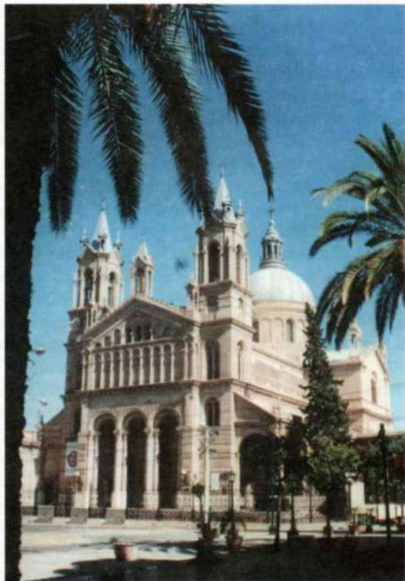
Vista de la Catedral

Venía de Vichigasta, acompañado de su madre,